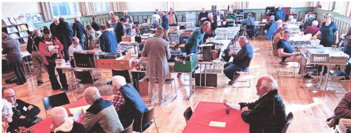
Die diesjährige Börse fand am 22. März in Wetzikon statt.