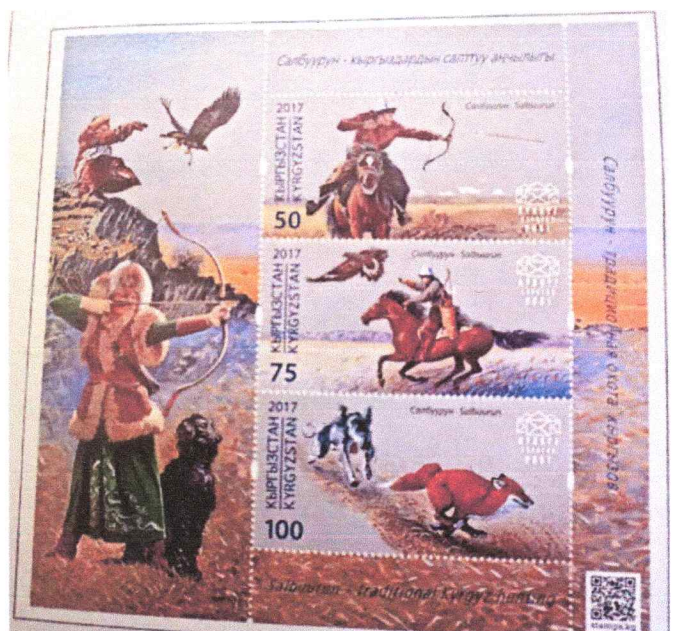
Diese Marken stammen aus Kirgistan.

Der Club bietet Beratungen an, wenn jemand beispielsweise eine Briefmarkensammlung geerbt hat und diese einschätzen lassen will. Zudem organisiert er jedes Jahr eine Vereinsbörse. Diese fand jetzt gerade am 22. März in Wetzikon statt. 13 Händler waren vor Ort, um ihre Waren zu präsentieren.